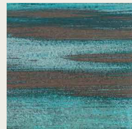
VERDERAME_WP FONDO 15081 + VERDERAME_WP LIQUIDO ANTICHIZZANTE