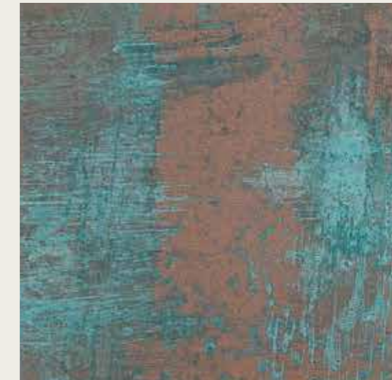
VERDERAME_WP FONDO 15080 + VERDERAME_WP LIQUIDO ANTICHIZZANTE - Effetto Strié