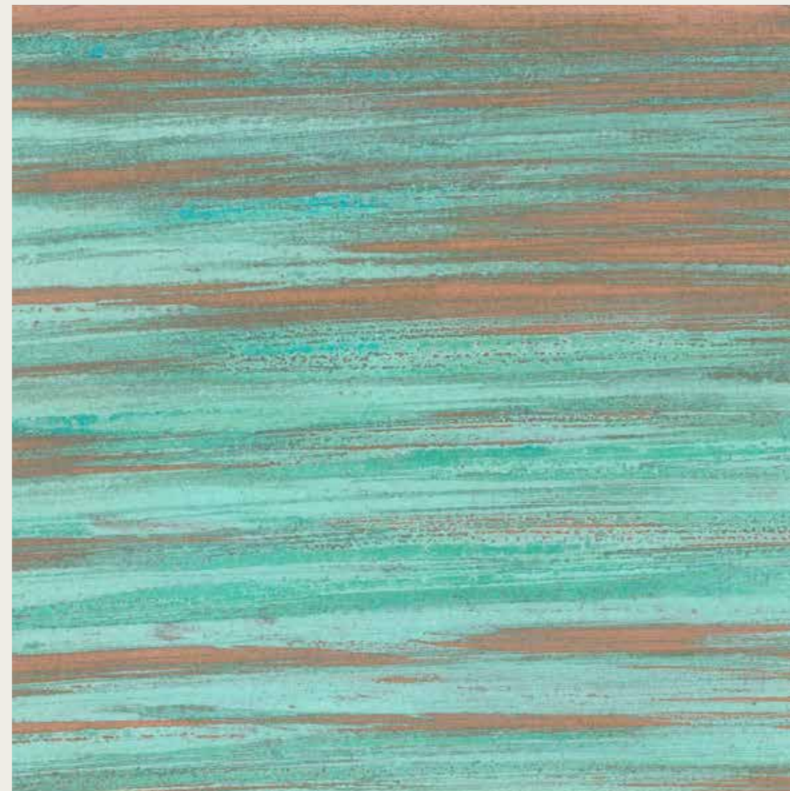
VERDERAME_WALL PAINTING FONDO + VERDERAME_WALL PAINTING LIQUIDO ANTICHIZZANTE

The power of oxidation and the beauty of verdigris